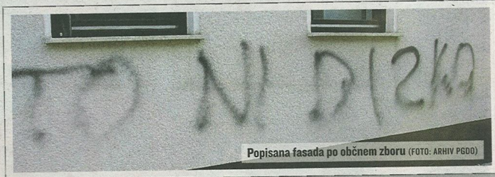
Popisana fasada po občnem zboru