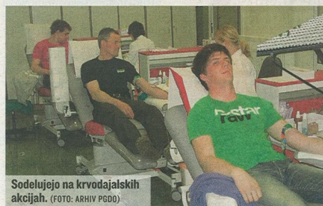
Sodelujejo na krvodajalskih akcijah.