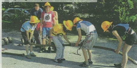
Skrbijo za gasilski podmladek.

ČE BOMO IZBRANI, BOMO GASILSKEMU DOMU POVRNILI LEPOTO IN IZBRISALI DEL ZGODOVINE, ZA KATEREGA ŽELIMO, DA BI ŠEL ČIM PREJ V POZABO.